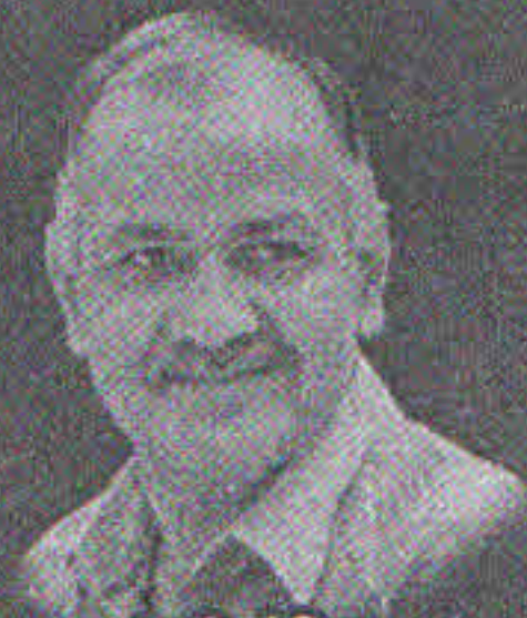
मनीष सिसोदिया उप मन्त्री, दिल्ली