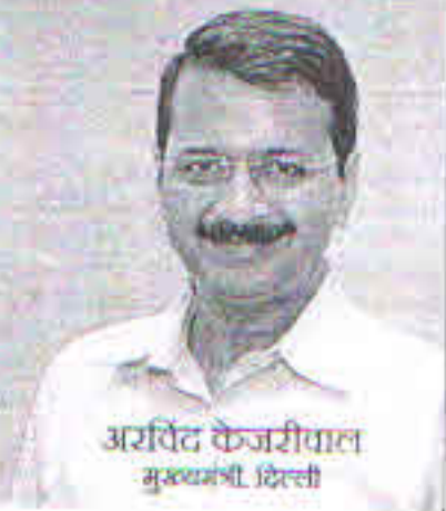
अरविंद केजरीवाल मुख्यमंत्री, दिल्ली

28 जून 2017, सुबह 7:50 बजे स्थान : इंडिया गेट लॉन